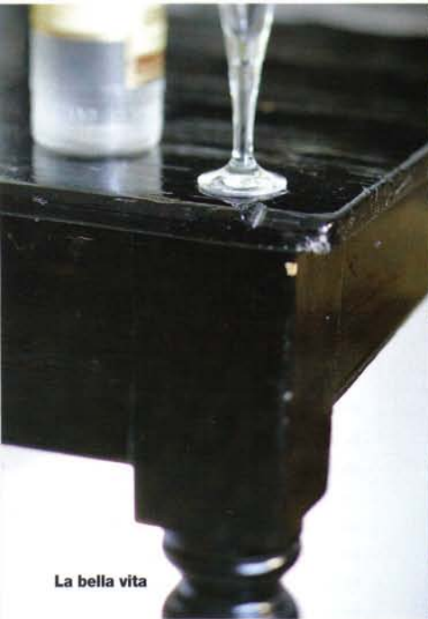
La bella vita